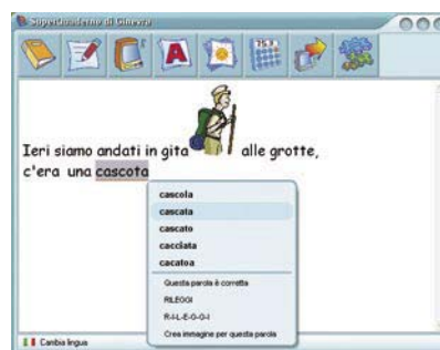
fig.2 - Suggestore in SuperQuaderno

Tutte queste opzioni sono eventualmente disattivabili, a seconda delle caratteristiche della persona e del tipo di lavoro che si sta svolgendo.