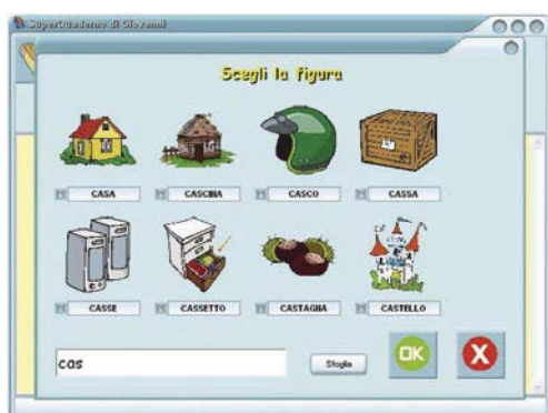
fig.7 - Libreria immagini di SuperQuaderno