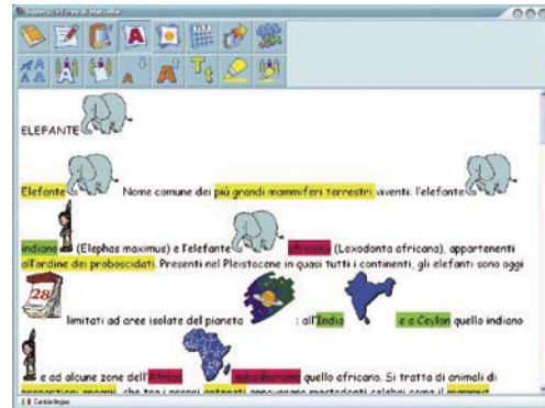
fig.6 - Uso evidenziatore in SuperQuaderno

I percorsi didattici e riabilitativi pianificabili con SuperQuaderno possono essere vari: