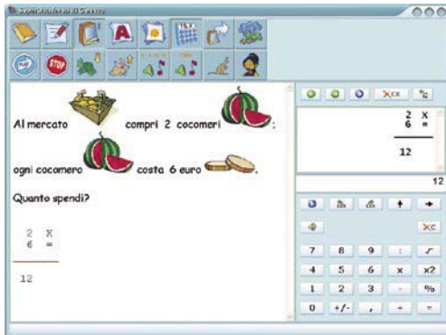
fig.5 - la calcolatrice di SuperQuaderno