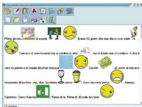
fig. 1 - Testo con immagini in SuperQuaderno

SuperQuaderno è un editor di testi multimediali realizzato per promuovere l'apprendimento della lettura e della scrittura, compensando le eventuali difficoltà con un quaderno digitale con testo, immagini e voce.